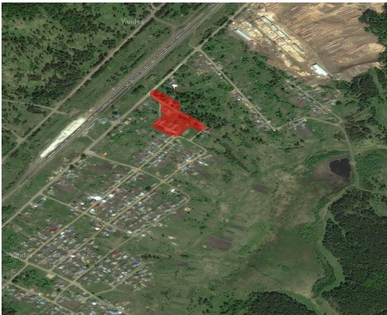
Рисунок 2.1 - Зона действия системы теплоснабжения

Зона действия системы теплоснабжения представлена на рис. 2.1